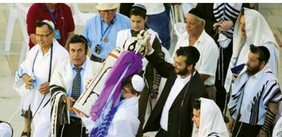
zu PSALM 128: Unsere Quelle.