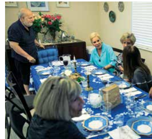
Eine jüdische Familie versammelt sich, um das Passah zu feiern. zu PSALM 124: Unser Helfer.