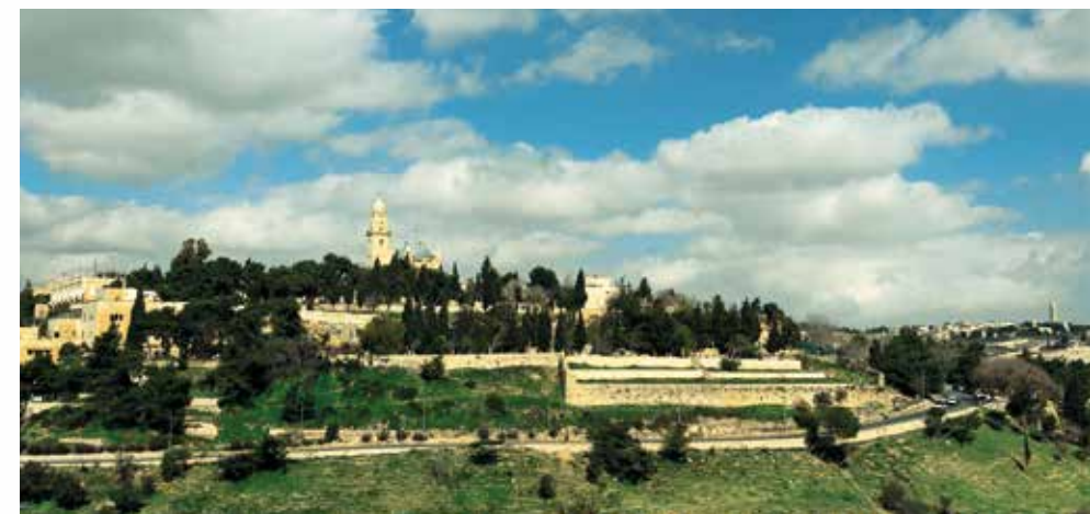
zu PSALM 125: Unser Beschützer.