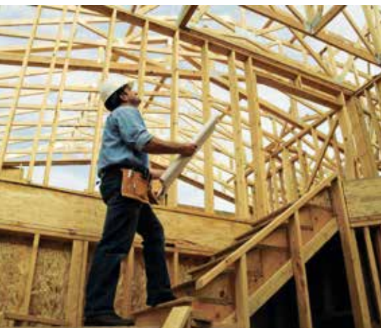
zu PSALM 127: Unser Versorger.

Mit jeder Strophe wird dieses Aufstiegslied persönlicher, es richtet sich zuerst an „jeden“ (V. 1), dann an „dich“ (V. 2) ganz direkt: