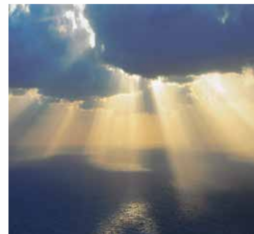
zu PSALM 123: Unser Fokus.

Der einzige, der uns wahrhaftig Sicherheit versprechen kann, ist der