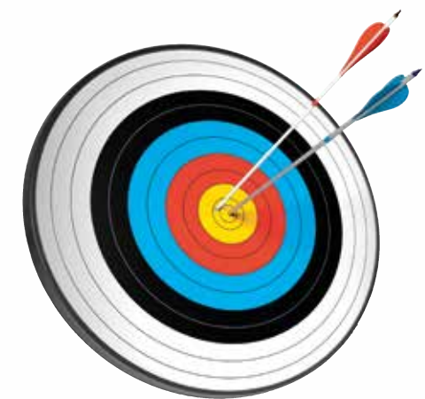
zu PSALM 120: Unser Retter.