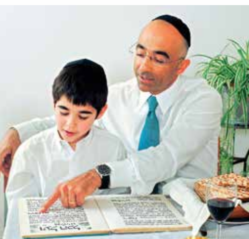
zu PSALM 122: Unser Friede und unsere Freude.

in Nordarabien und südlich von Israel gelegenen Wüstengebiete durchstreifen.