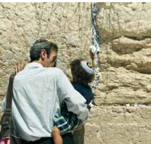
zu PSALM 121: Unsere Sicherheit.